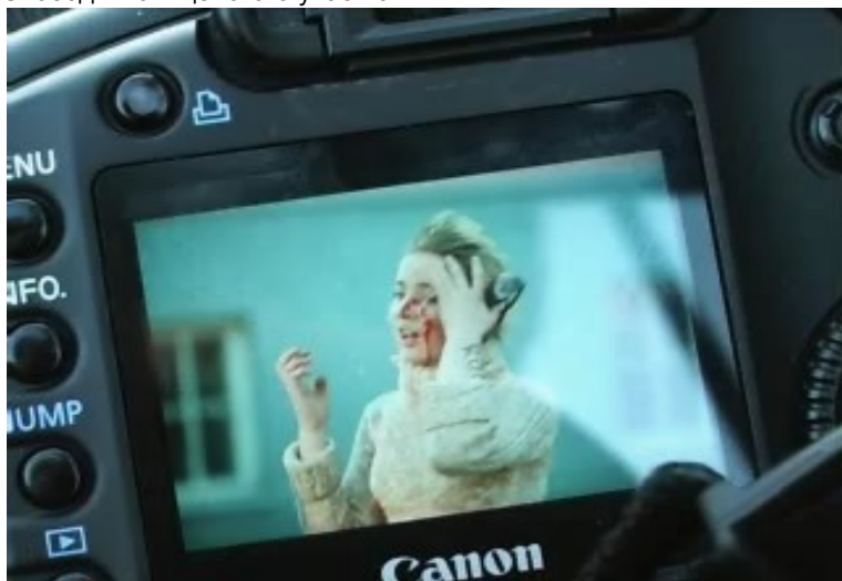
Кадр из фильма «Хроники Бронзовой Ночи»

Не менее агрессивно полицейские вели себя на подходах к площади Свободы. В парке напротив гостиницы "Виру" полицейские также без всякого повода набросились на четырех молодых людей, сидящих на скамейке, и повалили их на землю лицом вниз. Недоуменные крики подростков стихли, когда здоровенные мужчины в униформе заломили им руки за спины и закрепили их строительными пластиковыми жгутами. Толпа комментировала эти действия дружным скандированием "Позор! Позор!". Строительные жгуты белого цвета в этот вечер стали главным орудием "пленения" задержанных. Повсюду был слышна команда полицейских "Rikali!" ("Лечь на землю!"). С задержанными не разбиралась, их тут же волокли куда-то в сторону. Шла массовая "зачистка" протестующих. С наступлением темноты агрессивность сил правопорядка достигла максимума, и люди просто начали разбегаться при их появлении. Опять во все стеклянное летели камни - досталось окнам расположенного прямо у входа на площадь Свободы полицейского участка.